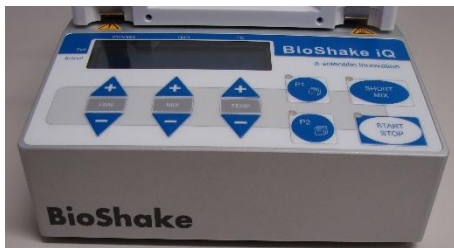
Ansicht von vorn