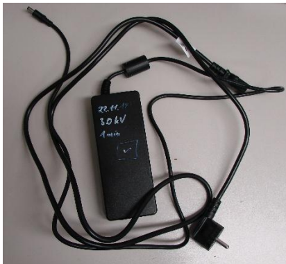
Ansicht von Anschlussleitung